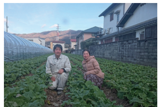
八尾市・若ごぼう農家さん訪問