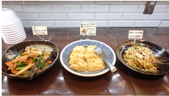
卵とネギを油揚げに詰めて煮た人気メニュー「きんちゃく煮」