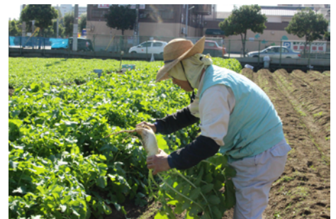
大阪市内の農園より野菜を仕入れる