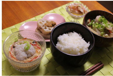
門真れんこんの会