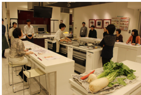
講師は大阪市立大学の学生