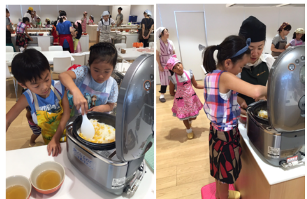
親子50名で親子クッキング(ハグミュージアムにて)