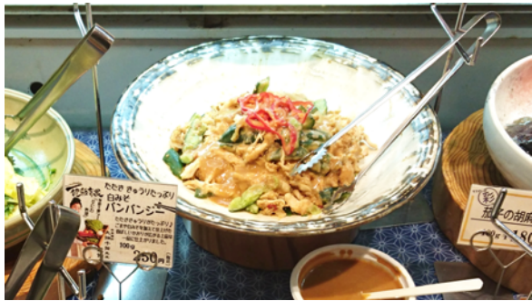
白味噌ベースのピリ辛ソースが決め手のパンバンジー

2016年7月～ 鳴門屋製パン株式会社運営「惣菜 彩」と契約開始 お惣菜開発担当