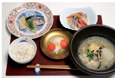
学生とともにレシピ開発